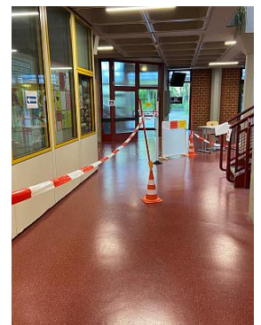
Maskenpflicht und ein Mindestabstand von 1,5 Metern sind auch in den Gängen einzuhalten.