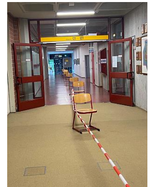
Auch Einbahnstraßen gehören zum neuen Wegesystem im Schulgebäude.