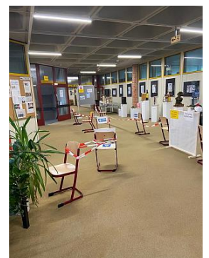
Alle nötigen Infos zu den Hygieneregeln erhalten die Schüler rechtzeitig vor der Rückkehr an ihre Schule.